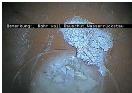
Bemerkung: Rohr voll Bauschutt, Wasserrückstau