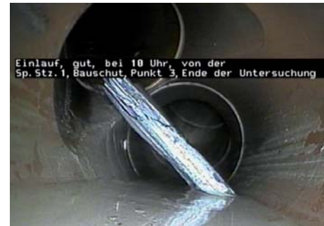
Einlauf, gut, bei 10 Uhr, von der Sp. Stz. 1, Bauschutt, Punkt 3, Ende der Untersuchung