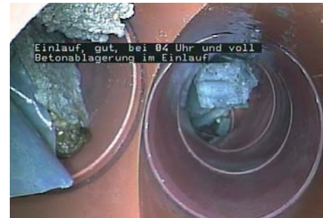
Einlauf, gut, bei 04 Uhr und voll Betonablagernung im Einlauf