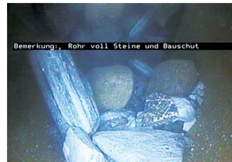
Bemerkung: Rohr voll Steine und Bauschutt

Nummer sicher. Setzen Sie auf Werterhalt, gegen Rückstaus und böse Überraschungen, damit ein Haus durch Baurückstände nicht unter Verstopfung leidet.