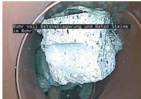
Rohr voll Betonablagernung und Beton Steine im Rohr