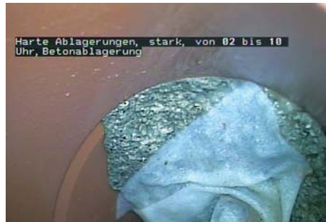
Harte Ablagerungen, stark, von 02 bis 10 Uhr, Betonablagernung

In Süddeutschland: RohrMax GmbH Ein Tochterunternehmen der RohrMax AG Schweiz Niederlassungen in Lörrach, Konstanz, Friedrichshafen www.rohrmax.de, info@rohrmax.de 24h-Service: 0180 1 764 762