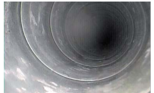
Gut gewartete Lüftungssysteme tragen zum Lebenskomfort bei – statt mit Hausstaub kontaminiert.