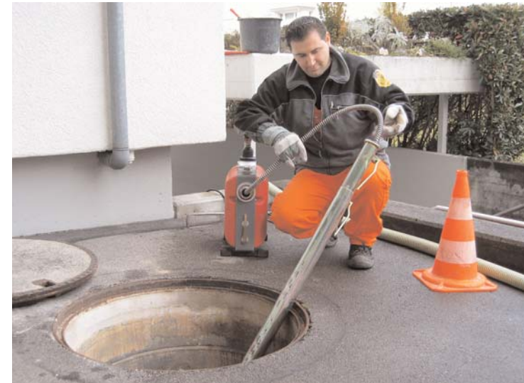
Verstopfte Leitungen: Werden aufgeböhrt und durchgespült.

Klaus P. hat eine solche Kontrolle übrigens ebenfalls angefordert und dadurch herausgefunden, warum die Wände in seinem Haus feucht sind. Das Beheben der Ursache war dann nur noch eine Kleinigkeit. Die Folge davon: seither sind seine Heizkosten spürbar zurückgegangen.