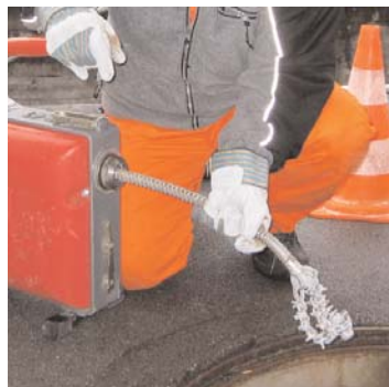
Bohrer: Entfernt Hartnäckiges.